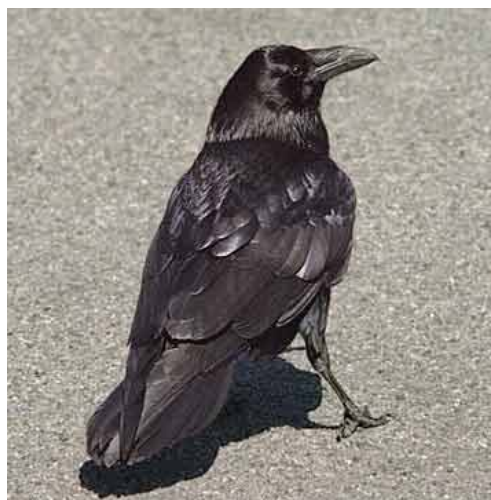
Ravnen, den mytologiske fugl som også indgår i Mittarfeqarfiits logo.

Antallet af ravne stabilt eller faldende på den fleste af Mittarfeqarfiits lufthavne, dog undtaget Kangerlussuaq, hvor antallet har været stigende gennem de sidste år. Mittarfik Kangerlussuaq arbejder sammen med Qeqqata kommunia (Midtkommunen), som Kangerlussuaq hører under, om at nedbringe antallet af fugle ved bygdens dump.