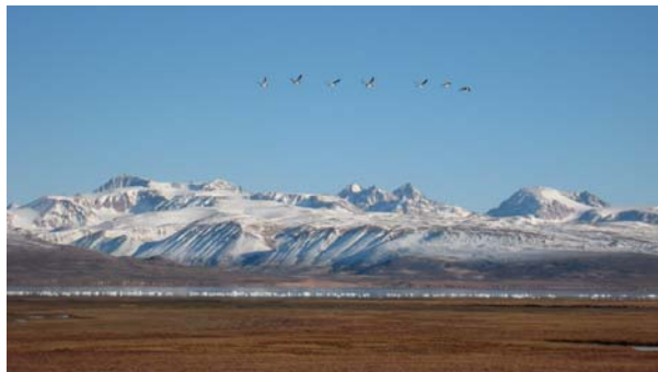
Gæs trækker over Nerlerit Inaat